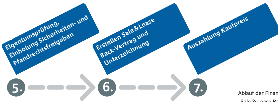
Ablauf der Finanzierungsform „Sale & Lease Back“. Abbildung: Maturus Finance GmbH

dell häufig in Produktionsbetrieben zum Einsatz, zum Beispiel aus der Metall- bzw. Kunststoffbe- und -verarbeitung, der Nahrungsmittelindustrie, der Textilproduktion, der Verpackungsindustrie, der Druckindustrie oder auch im Hoch- und Tiefbau sowie der Transportlogistik. Finanziert werden dann zum Beispiel klassische Baumaschinen oder Kühltransporter. Möglicherweise können auch Maschinen oder Transporter aus kurzfristig auslaufenden Mietkauf- oder Leasingverträgen abgelöst und in eine Finanzierung einbezogen werden, wenn der Zeitwert über dem Ablöswert liegt. Voraussetzung für diese Finanzierungsart ist, dass die Assets mobil sind. Verkettete Anlagen, die manchmal sogar mit der Halle verbaut sind, kommen demnach nicht in Frage.